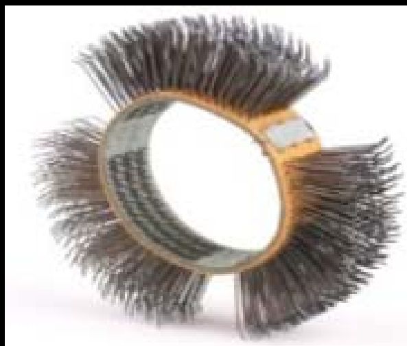
Cepillos MBX medio punta cincel