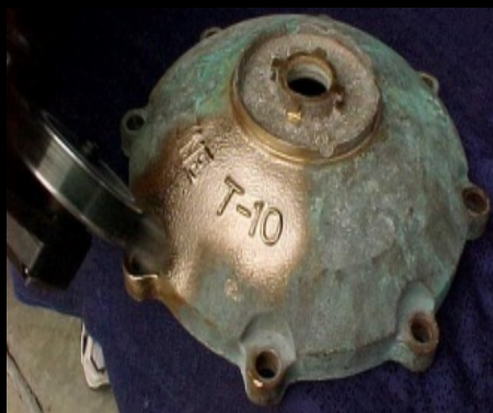
Eliminación de corrosión