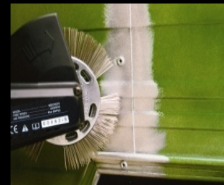
Remaches de aluminio