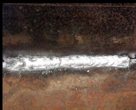
Limpieza de cordones de soldadura