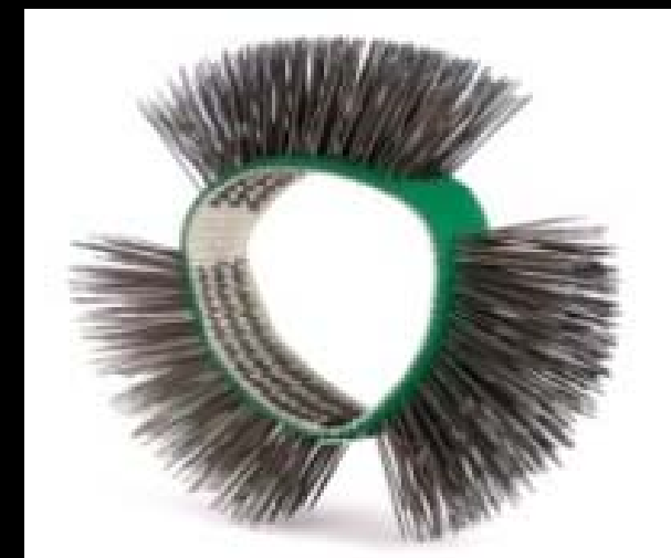
Cepillos MBX fino punta recta