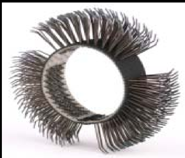
Cepillos MBX grueso punta cincel

CEPILLOS DE ACERO AL CARBONO MBX EN 11 mm. y 23 mm.