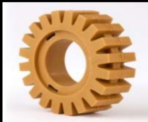
Cepillos de caucho