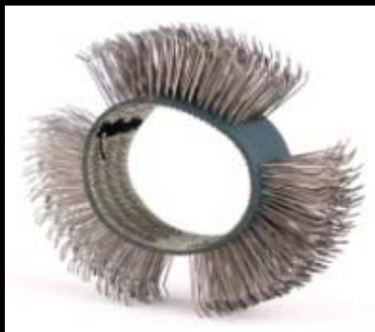
Cepillos MBX punta cincel

CEPILLOS DE ACERO INOXIDABLE MBX EN 11 mm. y 23 mm.