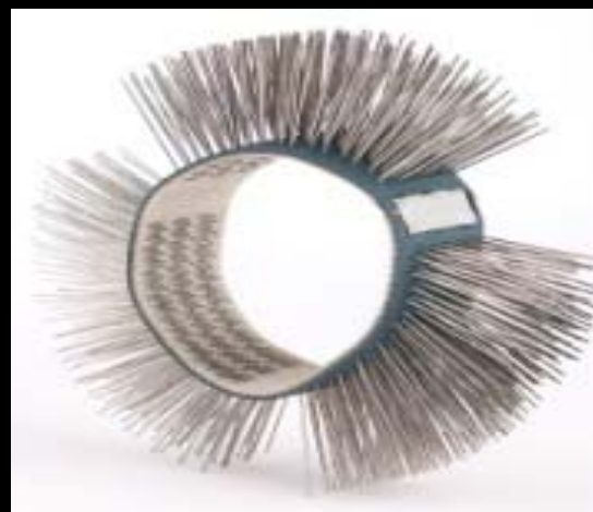
Cepillos MBX punta recta